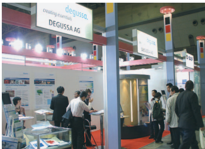
Bild 3: Auf dem deutschen Pavillon zeigte die Degussa AG eine Weltneuheit: Keramiktapeten, die schwerentflammbar, schmutzabweisend, optisch überzeugend und kostengünstig sind