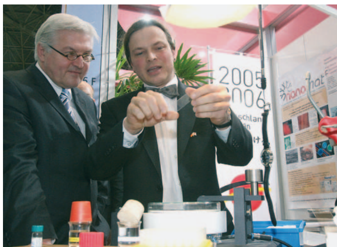
Bild 4: Dr. Stefan Walheim begeistert den deutschen Außenminister Frank-Martin Steinmeier mit einem Live-Experiment während der nano tech 2006